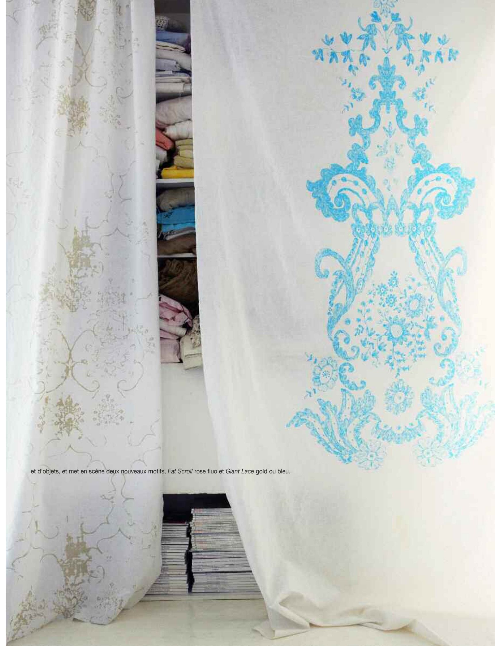
et d'objets, et met en scène deux nouveaux motifs, Fat Scroll rose fluo et Giant Lace gold ou bleu.

Script, Blossom, Lace , d'une étonnante modernité évocatrice de mots choisis, romantisme, poésie, fluidité, lyrisme, flottement, transparence, ornement, pétilllement... où tout fait écho avec des rebondissements colorés. Aussi profonde qu'elle paraît légère, Carolyn Quartermaine bâtit ses harmonies à la manière d'une costumière, s'inspire des petits riens de tous les jours, boîte en fer-blanc décorée, papier d'emballage épicer, produits ménagers, revues, bouts de chiffons, bijoux, chaussures... auxquels elle porte une tendre attention, n'oublie jamais les fleurs, collectionne des trésors d'accessoires, s'entoure de portraits en noir et blanc, tout en citant Cocteau, Bérard et Cy Twombly qui lui inspirent la vivacité d'un geste. Virtuose et instinctive, elle n'a pas son pareil pour courir brocanteurs et déballages d'antiquaires, dénicher un salon de jardin en fer forgé écaillé des années 1940-1950, une carcasse de fauteuil en bois doré, un guéridon Knoll, un lot de girandoles dans leur jus, passionnément accumulés, dont elle saupoudre ses intérieurs. Ainsi en va-t-il de sa maison-atelier du Midi, un volume contemporain baigné de lumière, entièrement offert aux délicates extravagances de ses mains volubiles. Un mystérieux pêle-mêle divinement maîtrisé, un art. Contact page 304.